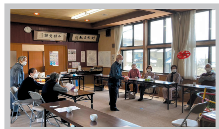
藤塚区健康達人区らぶ