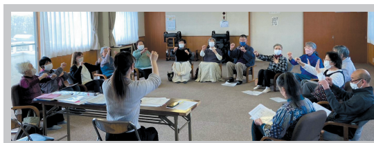
四ツ谷区健康達人区らぶ