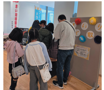
お菓子すくい取り