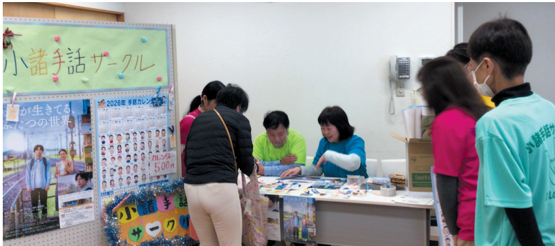
ふれあいマルシェ

ふれあいまつりでは、今年も「美術展」と「ふれあいマルシェ」が同時開催され、どの会場も訪れた人たちの目がキラキラ輝く、にぎやかなひとときとなりました。色とりどりの絵画や、丁寧に作られた工芸品、個性豊かな立体作品が会場を彩りました。ボランティア団体や福祉事業所が出店し、クッキーや焼きいもといった食品や、手作り雑貨、小物など、心のこもった品々が並びました。